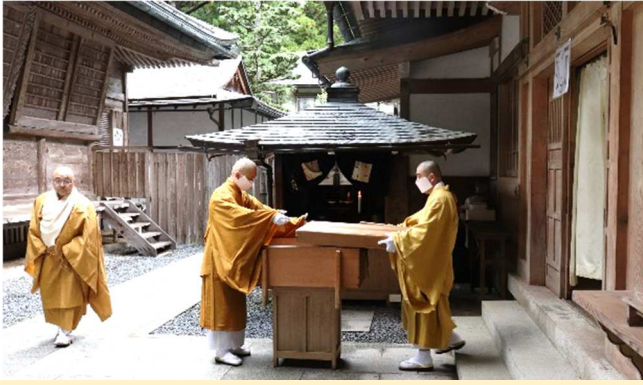
③ 合格したら箱に入れて..