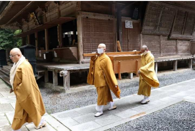
⑤ さっさと速足で歩きます