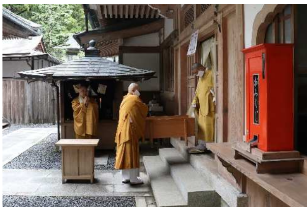
① ご飯ができました〜