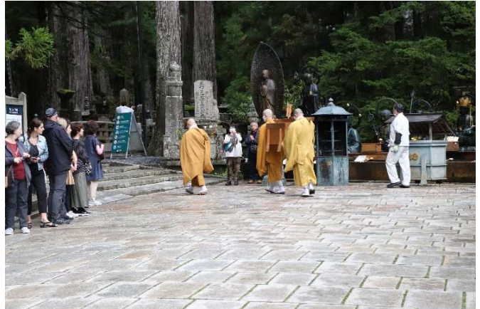
⑥ あっという間に通り過ぎました