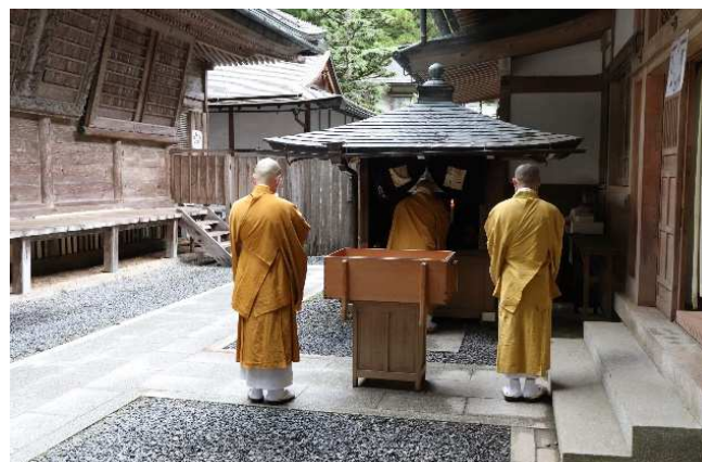
② 嘗試地蔵さんにチェックしてもらいます